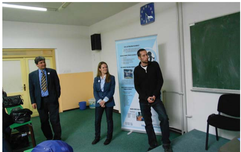
Predavanje zagrebačke delegacije u Bihaću

Kolege iz Bihaća podijelili su s nama svoju želju da od iduće akademske godine i službeno otvore prostorije za pružanje besplatne pravne pomoći po uzoru na Pravnu kliniku u Zagrebu