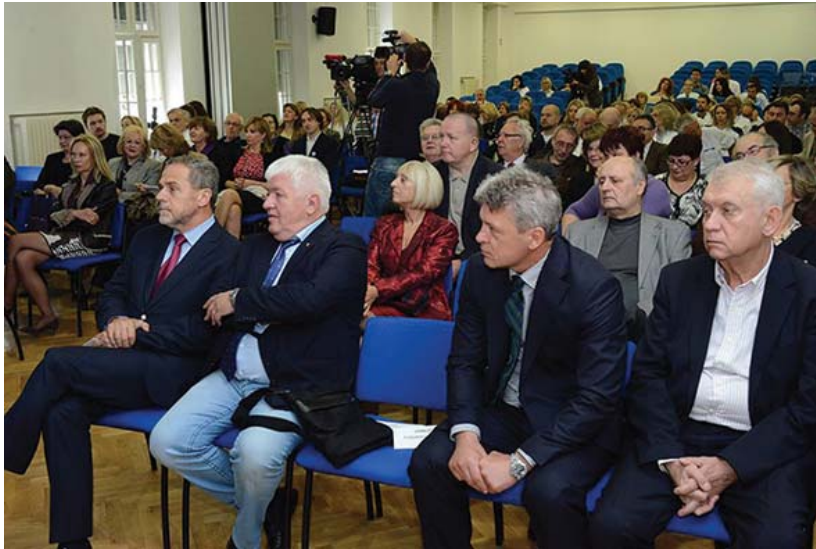
Uzvanici na Simpoziju