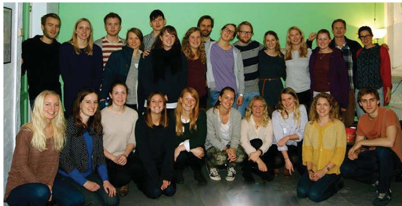
Norveška pravna klinika Juss-Buss

Pravna klinika ostvarila je suradnju s brojnim udrugama civilnog društva. Posjeti gradovima