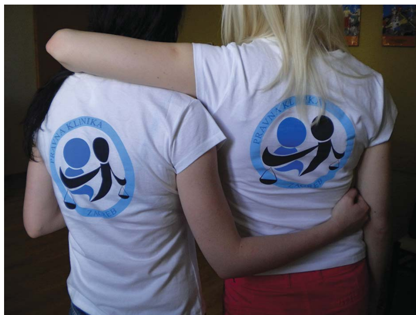
Vesele volonterke u Zadru