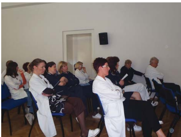
Osoblje bolnice na predavanju Kliničara