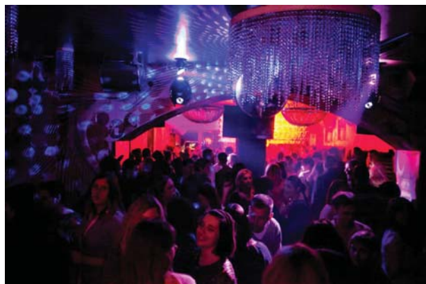
„Humanitarka“ u Maraschinu

Nakon stotinu sati priprema, nekoliko tisuća poklonjenih osmijeha, neumornih prilaženja građanima, volontiranja i međusobnih