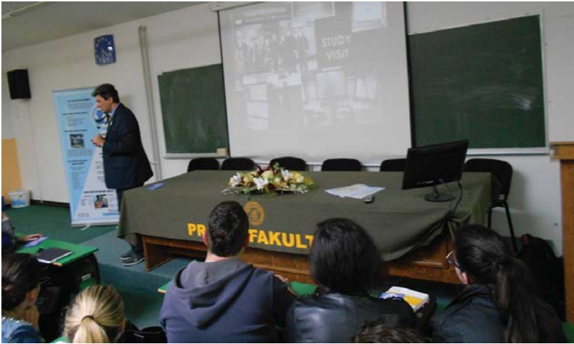
Predavanje prof.dr.sc. Alana Uzelca studentima u Bihaću

i biti otvoren za građane koji im se obrate za pomoć.