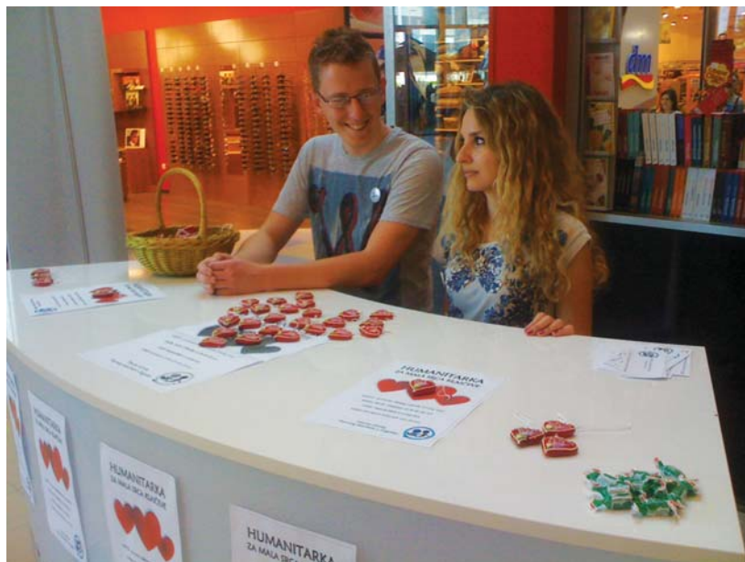
Nasmiješeni kliničari u Avenue Mallu

Prvi dio akcije zamišljen je kao humanitarni tulum u zagrebačkom klubu Maraschino, a novac smo prikupljali dobrotvornim priložima i prodajom ulaznica. Ulaznice su kupili mnogi koji nisu planirali doći u Maraschino, ali su nam odlučili pomoći. Nesebičnima su se pokazali brojni studenti, profesori i asistenti na