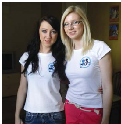
Volonterke Pravne klinike za vrijeme obavljanja vanjskih klinika u Zadru