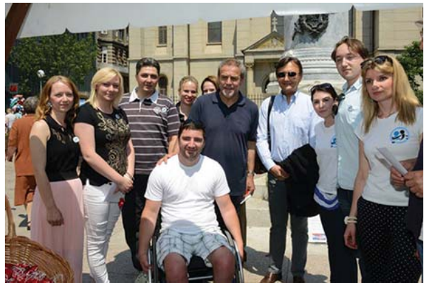
Vodstvo Klinike, Zaklade, studenti, gradonačelnik