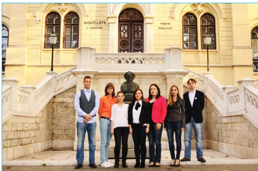
Urednici Pro bono biltena