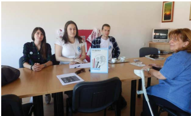
Vanjska klinika u Koprivnici