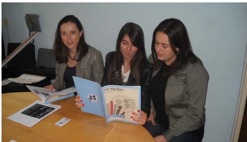
Nigdje bez Pro Bona