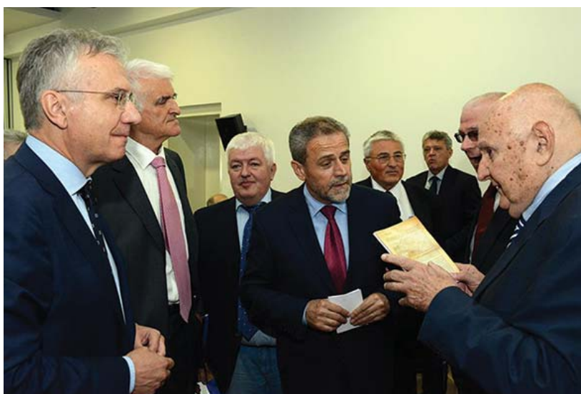
Uzvanici na Simpoziju

Možete zaključiti da je za Pravnu kliniku i mene simpozij značajan upravo zbog knjižice „Vaša prava“, koja se bavi temeljnim pravima pacijenata s duševnim smetnjama. Knjižica je na simpoziju prošla