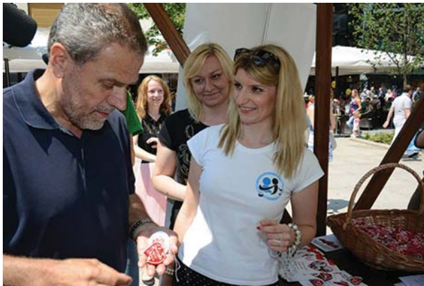
Gradonačelnik je odlučio pomoći ...