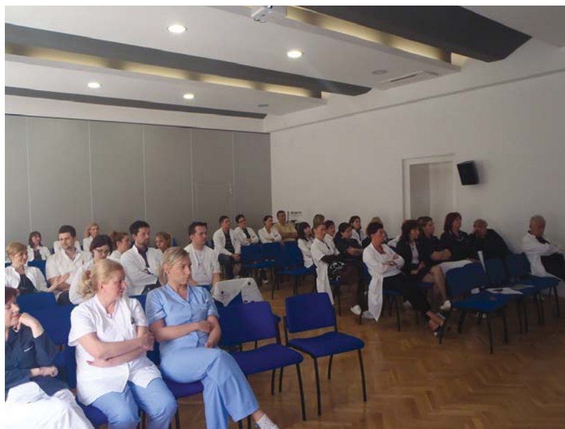
Predavanja o novom Kaznenom zakonu