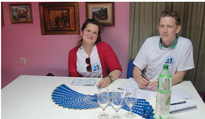
Dobrog raspoloženja ne nedostaje

Najvažniji zadatak grupe bio bi održavanje komunikacije s lokalnim medijima, kako bi građani pravovremeno bili obaviješteni o dolasku kliničara i o terminima održavanja dežurstava u njihovim gradovima. Članovi grupe sami bi obavještavali lokalne medije o održavanju vanjskih klinika, kako gradovi i udruge ne bi bili posrednici između Klinike i medija, što se u nekim slučajevima pokazalo kao nedostatak. Kao što Pravna klinika općenito te svaka pojedina grupa Pravne klinike na Facebook stranici ima otvorenu tajnu grupu preko koje kliničari međusobno komuniciraju, osnovat će se i Facebook grupa isključivo u svrhu vanjskih klinika. Na taj bi način sve informacije, obavijesti i novine u radu grupe bile odmah dostupne članovima. Projekt vanjskih klinika izniman je projekt koji je postignutim rezultatima doprinio razvoju svijesti studenata o vrijednosti i važnosti rada u javnome interesu te promoviranju volonterstva i pro bono rada radi zaštite socijalno osjetljivih skupina i osoba koje ne mogu ravnopravno ostvariti prava na pravnu zaštitu.